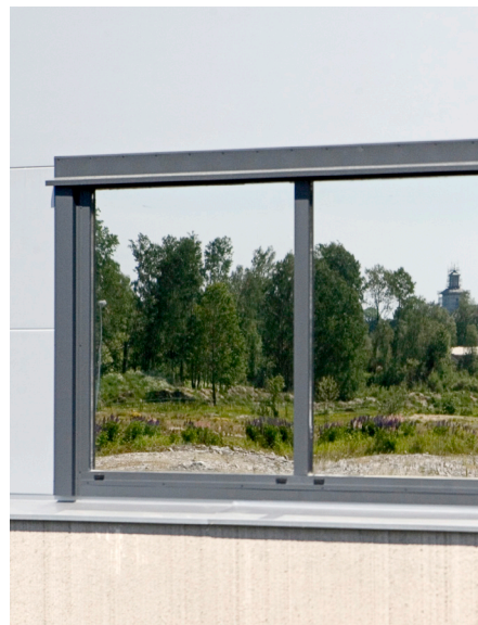
Termovindu med grå pladebeklædning.