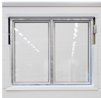
Varmforzinket karm indvendig.