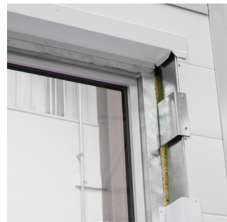
Befæstigelse med pladevinkel