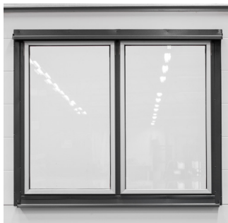
Yderside med pladebeklædning.

Vi vet at våre porter holder – og at de holder det vi lover. Derfor følger det alltid med 10 års garanti, uansett hvilken løsning du velger.