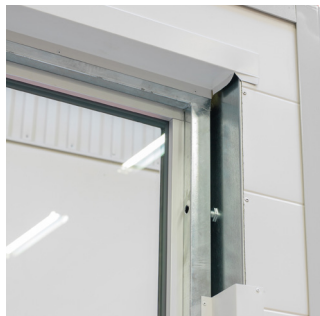
Befæstigelse med karmskruer.